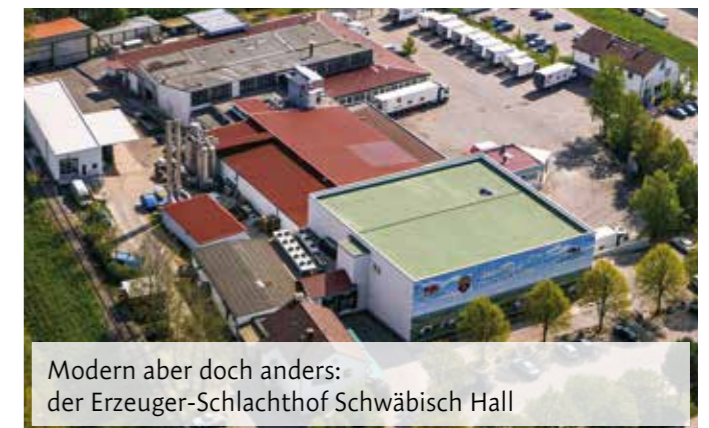
Modern aber doch anders: der Erzeuger-Schlachthof Schwäbisch Hall

Die bäuerliche Erzeugergemeinschaft Schwäbisch Hall betreibt seit 2001 den ehemals städtischen Schlachthof in Schwäbisch Hall und wurde damit zum Erzeuger-Schlachthof der Bäuerlichen Erzeugergemeinschaft Schwäbisch Hall. Er wurde von Anfang an als Bauern- und Bürger-Projekt entwickelt, um der Region erhalten zu bleiben. Gerade in Krisenzeiten erkennt man, wie wichtig es ist, regionale Strukturen, Kreisläufe und deren Wertschöpfungskette zu erhalten. Er ist von der Struktur her nicht zu vergleichen mit den in der Kritik stehenden Großschlachthöfen. Sämtliche Mitarbeiter, egal ob direkt oder über Personaldienstleister, sind langjährig beschäftigt, fest in Deutschland angestellt und sozialversichert. Der hausinterne Mindestlohn liegt deutlich über dem allgemeinen Mindestlohn.