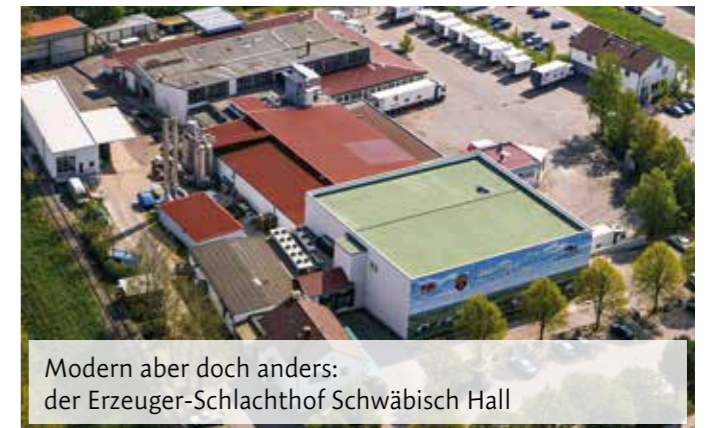
Modern aber doch anders: der Erzeuger-Schlachthof Schwäbisch Hall

Die bäuerliche Erzeugergemeinschaft Schwäbisch Hall betreibt seit 2001 den ehemals städtischen Schlachthof in Schwäbisch Hall und wurde damit zum Erzeuger-Schlachthof der Bäuerlichen Erzeugergemeinschaft Schwäbisch Hall. Er wurde von Anfang an als Bauern- und Bürger-Projekt entwickelt, um der Region erhalten zu bleiben. Gerade in Krisenzeiten erkennt man, wie wichtig es ist, regionale Strukturen, Kreisläufe und deren Wertschöpfungskette zu erhalten. Er ist von der Struktur her nicht zu vergleichen mit den in der Kritik stehenden Großschlachthöfen. Sämtliche Mitarbeiter, egal ob direkt oder über Personaldienstleister, sind langjährig beschäftigt, fest in Deutschland angestellt und sozialversichert. Der hausinterne Mindestlohn liegt deutlich über dem allgemeinen Mindestlohn.